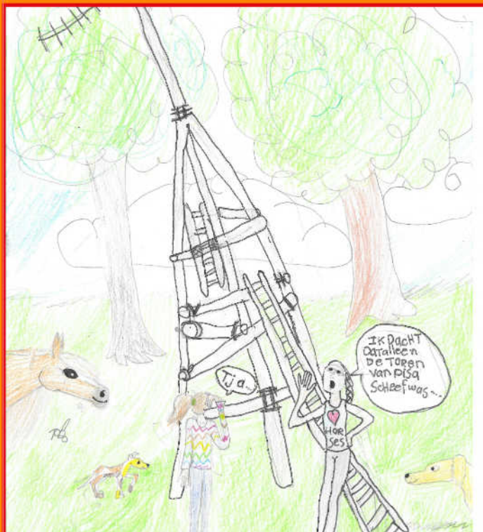
De Jotatoren door welp Madelief

Twee scouts komen elkaar tegen op de JAMBOREE zegt de ene tegen de andere ik ken nog een goede mop over een bloem. Zegt ander ik wil hem wel horen, maar dan wel in het Engels. Zegt de eerste scout weer: nee, dan is die flower.