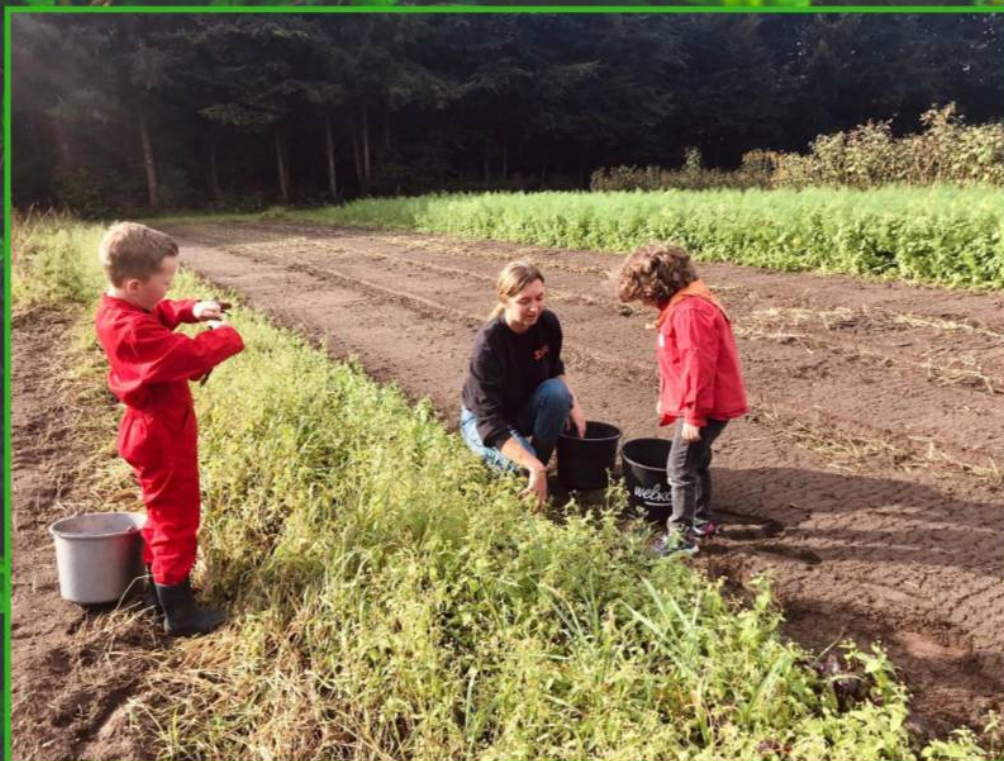
De bevers zijn bij de boerderij geweest