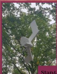
Stap 4. Maak een doelwit