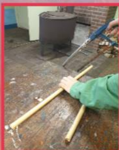
Stap 1. Zaag de buis 50CM lang