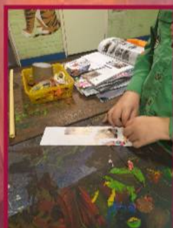
Stap 3. Draai de punt van de krant heel strak