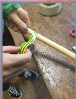
Stap 2. Versier de buis